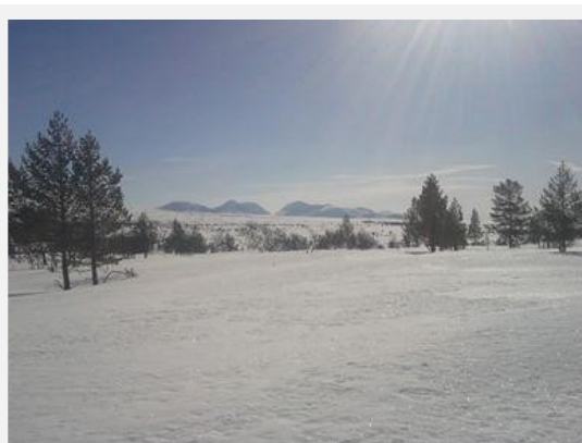
Utsikt mot Sjølen fra toppen av Rødvola

Hyttefelt beliggende ca 600 m.o.h. like ovenfor Unset i Rendalen med lyse og solrike tomter til salgs. Flotte friluftsmuligheter hele året!